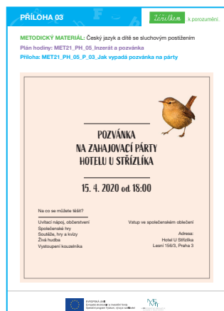
MET21_PH_05_P_03_Jak vypadá pozvánka na párty